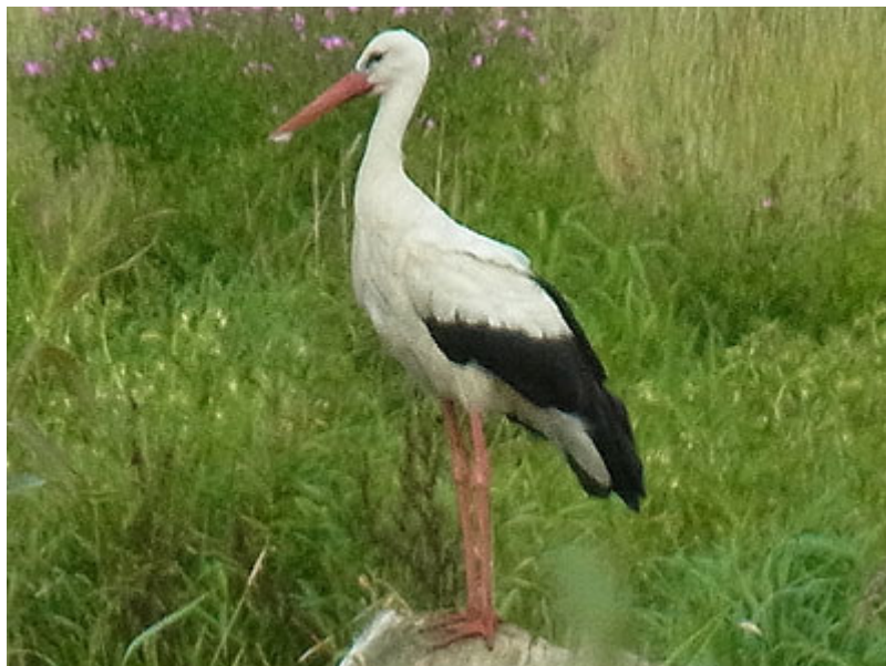
Abbildung 12: Am 20.7.2011 stand dieser Weißstorch längere Zeit auf einem Stein in der Wabe.