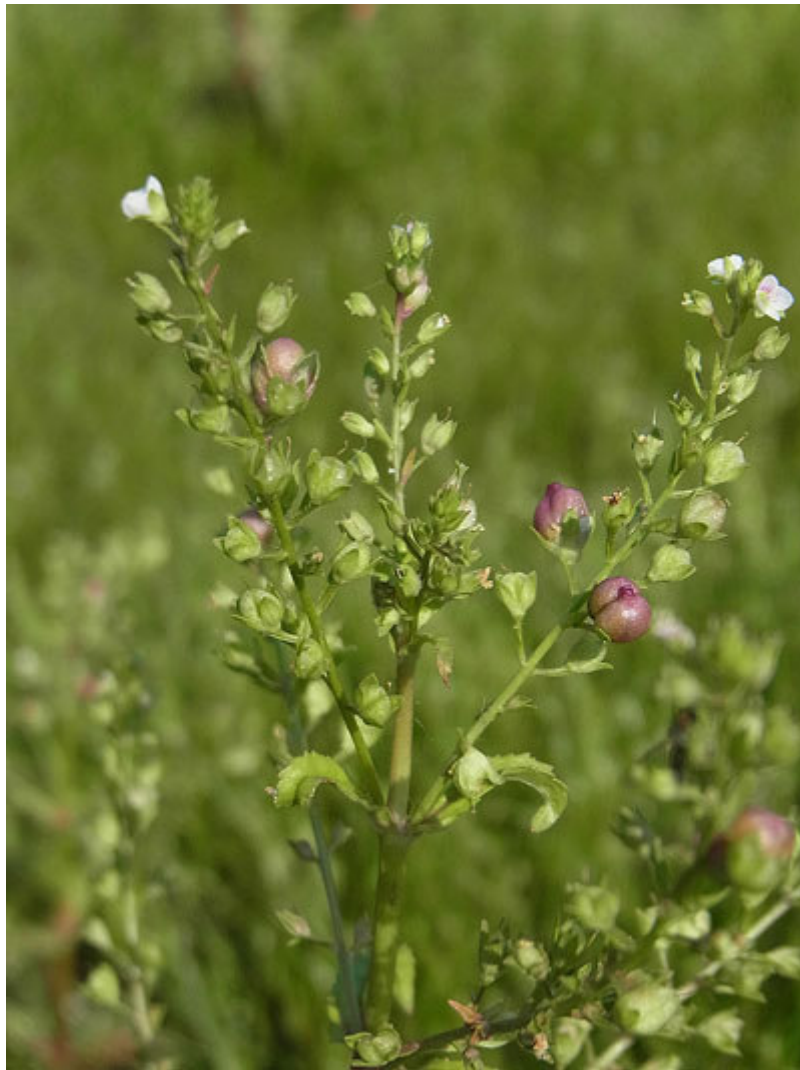
Abbildung 11: Die charakteristischen Gallen im Blütenstand von Veronica anagallis-aquatica verraten den Verursacher: den Rüsselkäfer Gymnetron villosulum (Foto: 9.6.2011).