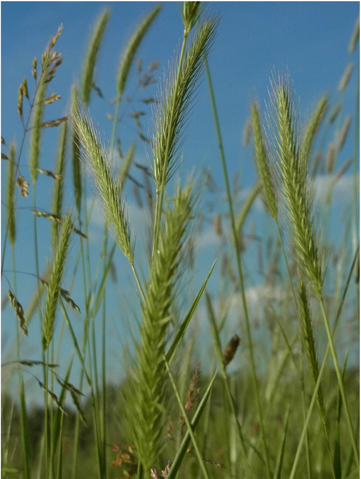
Abbildung 6: Eine herausragende Pflanzenart des UG ist die Roggen-Gerste ( Hordeum secalinum ), die sich in einem Bestand in der Nähe der Wabe im nördlichen Teil halten konnte (9.6.2011).