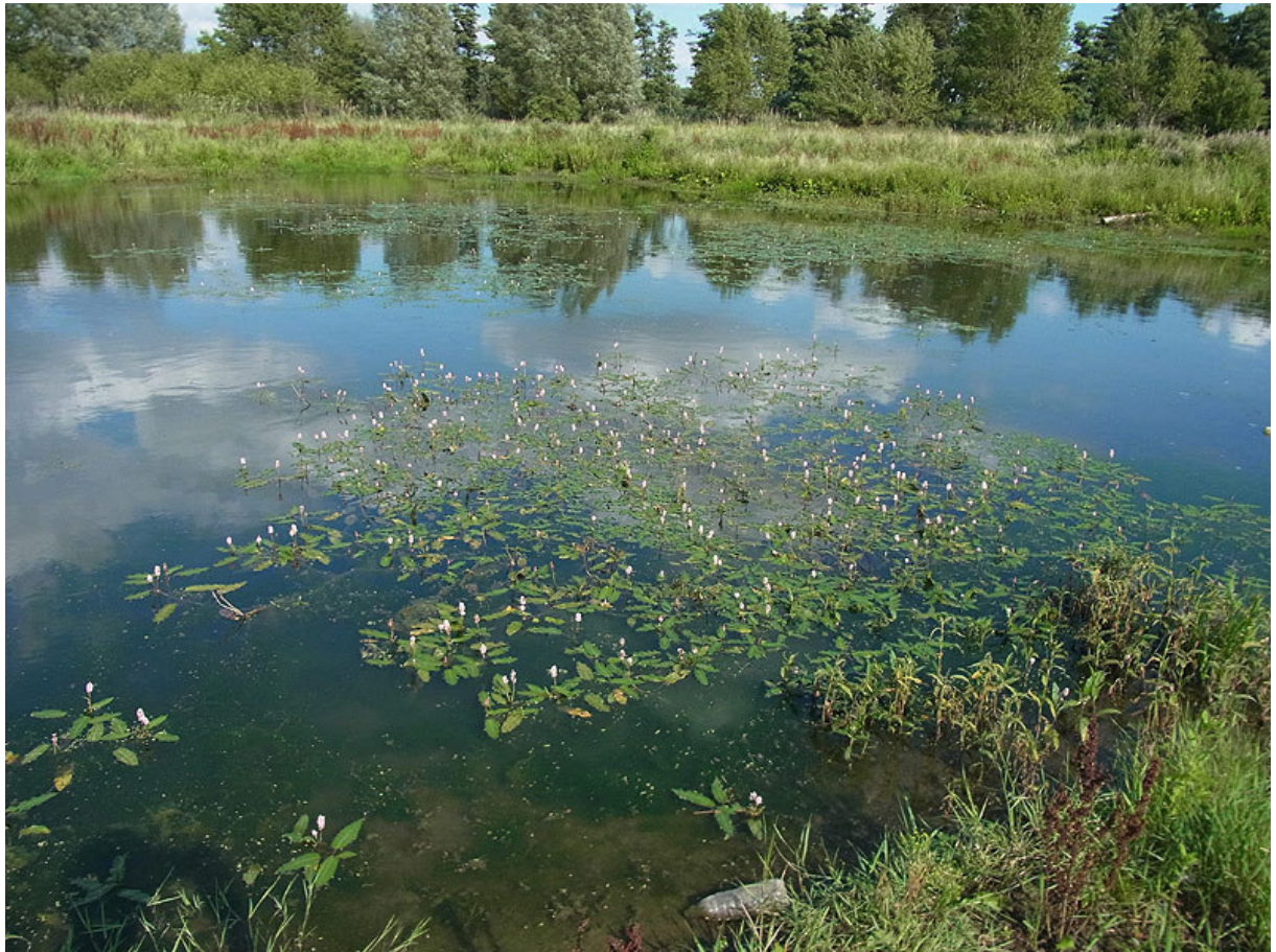
Abbildung 2: Flaches Stillgewässer im Südteil mit Persicaria amphibia f. natans (blühend) sowie Beständen von Potamogeton crispus , Myriophyllum spicatum und Zannichellia palustris (19.8.2011).