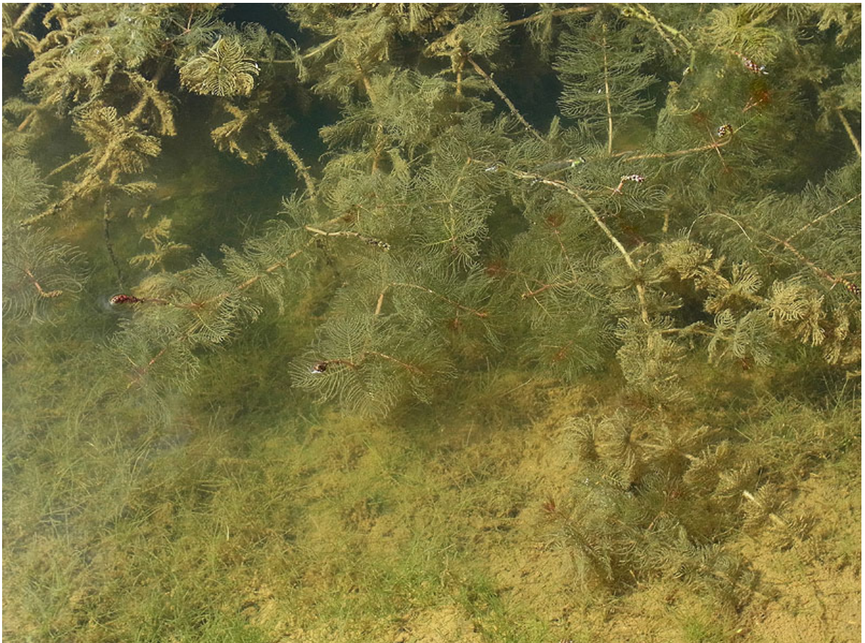
Abbildung 8: Das Ährige Tausendblatt ( Myriophyllum spicatum ) hat sich an einigen Stellen im UG angesiedelt (Foto: 19.8.2011).