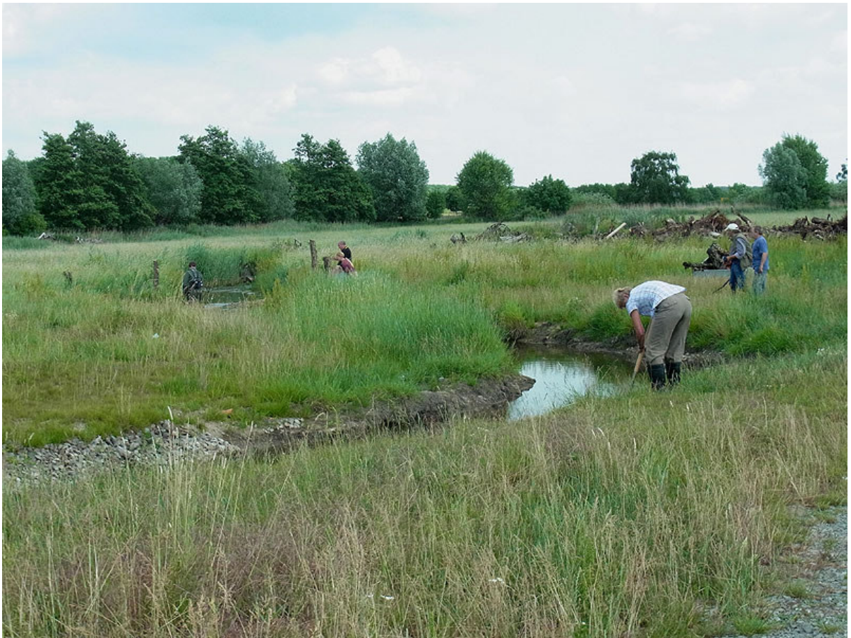
Abbildung 13: Interessante Gebiete wie dieses motivieren zur Mitarbeit (Foto: 9.6.2011).

Fotonachweis: P. Sprick, 2011 (alle Fotos stammen aus dem UG).