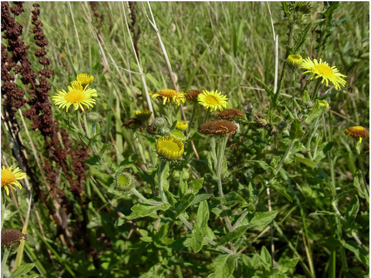
Abbildung 7: Im nördlichsten Teil des UG wurde das Große Flohkraut ( Pulicaria dysenterica ) in zwei kleinen Beständen gefunden (19.8.2011).