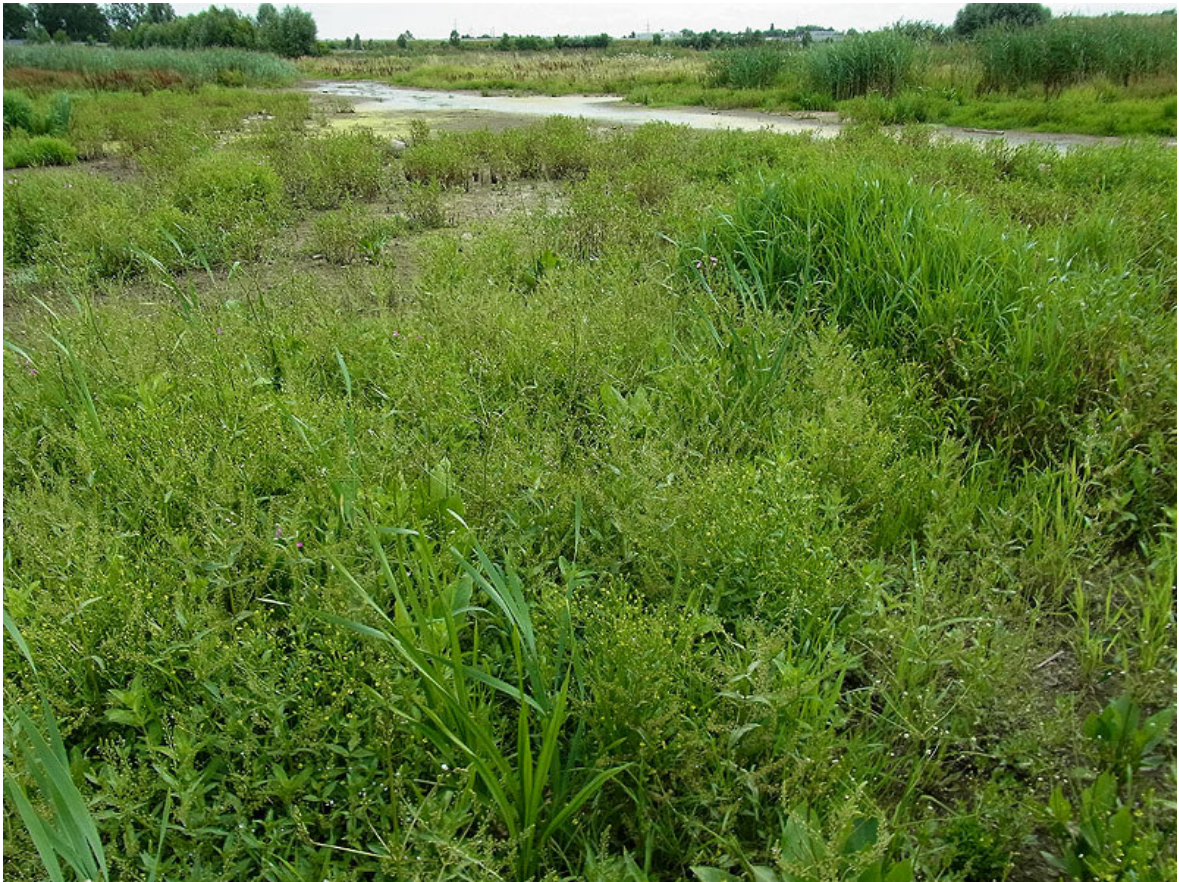
Abbildung 4: Nährstoffreiche Pionierfluren, hier mit größeren Beständen von Ranunculus sceleratus , wie sie im mittleren Teil des UG vorkommen, sind vor allem aus faunistischer Sicht wertvolle Lebensräume (20.7.2011).