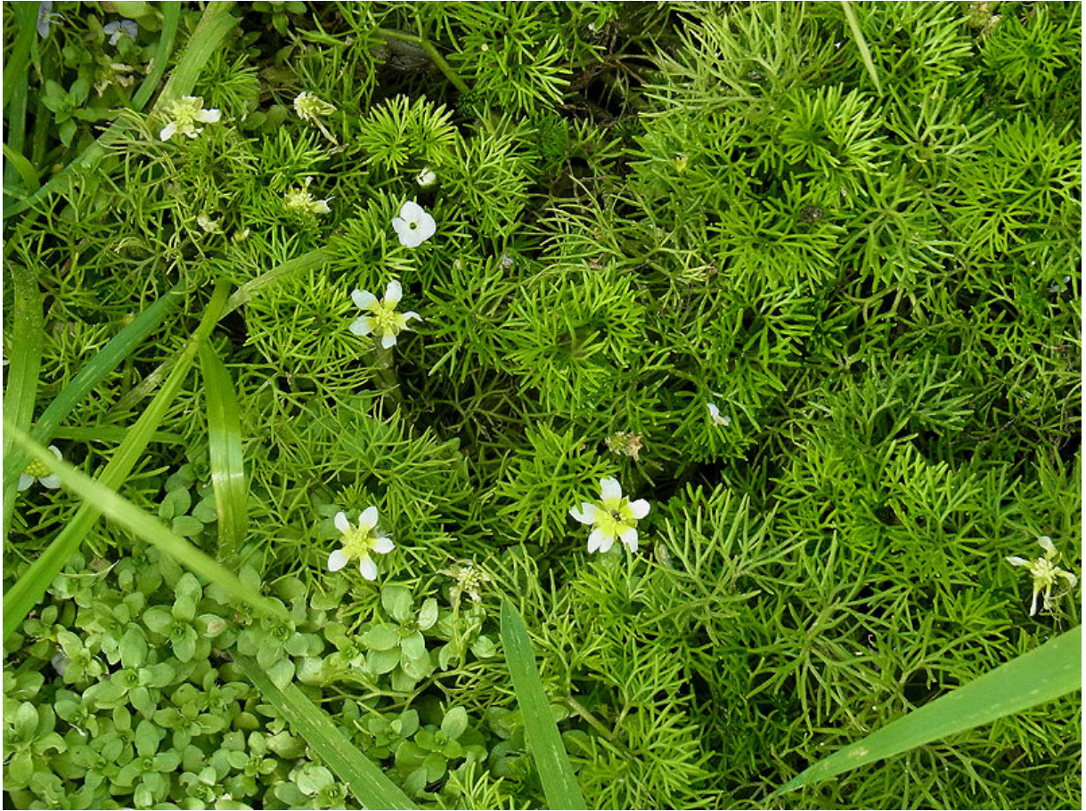
Abbildung 9: Der Haarblättrige Wasserhahnenfuß ( Ranunculus trichophyllus ) ist an den nicht überlappenden Blütenblättern und dem Fehlen von Schwimmblättern zu erkennen. Im UG wurde er 2011 vorwiegend an feuchten Stellen außerhalb der Gewässer angetroffen, hier zusammen mit Callitriche palustris agg. (Foto: 20.7.2011).