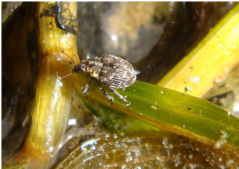
Abbildung 10: Der kleine Rüsselkäfer Pelenomus canaliculatus ist eine seltene Art, deren Larven sich nur an auf dem Schlamm aufliegenden Blättern von Tausendblatt-Arten entwickeln können (Foto: 20.7.2011).