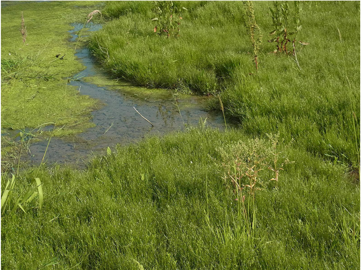
Abbildung 5: Ausgedehnte Zwergbinsenrasen (Ausschnitt) im nördlichen Teil des UG (9.6.2011).