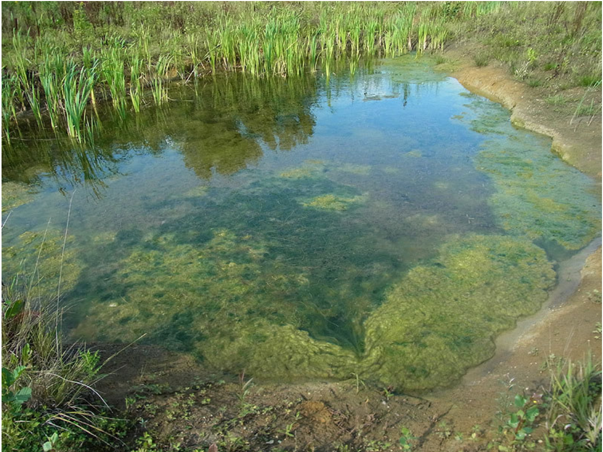
Abbildung 3: Neu angelegtes Stillgewässer (einer Dreiergruppe) nördlich der Gebüschpflanzung mit fädigen Grünalgen, Myriophyllum spicatum , Zannichellia palustris sowie dem hier dunkelgrün erscheinenden Potamogeton crispus (19.8. 2011).